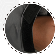
AJUSTE DE PUÑO CON VELCRO

PARKA FIX OREGÓN con costuras totalmente selladas excepcional capacidad de abrigo sin ser pesada ni voluminosa. Con buen nivel de impermeabilidad y transpirabilidad.