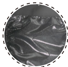
TELA TÉRMICA REFLECTANTE