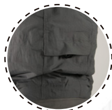
GORRO CON AJUSTE Y VELCRO